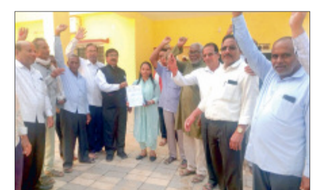
विदित हो कि छत्तीसगढ़ शासन द्वारा पेंशनरों के हक और अधिकार की उपेक्षा की जा रही है। प्रदेश के लाखों पेंशनरों में असंतोष व्याप्त है। भीषण महंगाई को देखते हुए पेंशनरों

पेंशनर्स एसोसिएशन छत्तीसगढ़ रायपुर पंजीयन क्रमांक 1844-छत्तीसगढ़ शासन के विभागों से सेवानिवृत्त हुए पेंशनर्स को, जिन्होंने अपने सेवा काल में शासन की योजनाओं को जन-जन तक पहुंचाने का काम किया। राष्ट्रीय स्तर पर अनेक पुरस्कार दिलाने वाले कर्मचारियों को सेवानिवृत्त होने के पश्चात शासन के समक्ष महंगाई भत्ता के लिए याचना करना पड़ रहा है। 2 प्रतिशत महंगाई भत्ता जनवरी 2025 से राज्य शासन द्वारा अपनी कर्मचारियों को दिया जा चुका है, परंतु अभी तक पेंशनरों को नहीं मिला है और 3 प्रतिशत जुलाई 2025 से केंद्र सरकार द्वारा केंद्रीय कर्मचारियों को दिया जा चुका है।