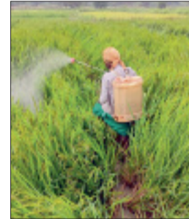
हुई बारिश से धान की खड़ी फसल को काफी नुकसान पहुंचा है। बालियों से लदे धान के पौधे खेतों में गिरने से

धान की फसल पर तरह-तरह के कीट व्याधियों के हमलों से किसान परेशान हैं। तनाछेदक, शीथ ब्लास्ट, माइट्स, भूरा माहो ने किसानों का जीना मुश्किल कर दिया है। फसल बर्बाद होने की आशंका से किसान चिंतित हैं। किसानों का कहना कि इस बार कम बारिश के बाद भी फसल अच्छी हो, इसके लिए काफी मेहनत की है। मगर तरह-तरह की बीमारियों से धान की फसल को बचाना एक बड़ी चुनौती बन गई है। पिछले दिनों