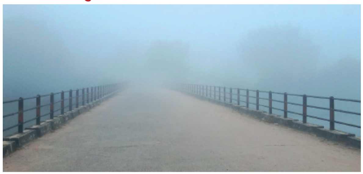
नर्रा। बीते तीन दिनों से मौसम खुला व बादल छंटते ही अलसुबह कोहरे की चादर से ढंका रहा क्षेत्र। साथ ही गुलाबी ढंड ने दस्तक दे दी है। अब लोगों को सुबह-सुबह ढंड का अहसास होने लगा है।