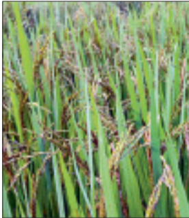
सड़ने लगे हैं। खेतों में इन दिनों तना छेदक, शीत ब्लास्ट और माहो का प्रकोप देखने को मिल रहा है। इन

महंगी दवा खरीदने के कारण किसानों की आर्थिक परेशानी बढ़ गई है। बीमारियों के चलते फसल खराब हो रही है। दवा छिड़काव के लिए मजदूर नहीं मिल पाने के कारण से भी दवा का समय पर छिड़काव नहीं कर पा रहे हैं। खेतों में पानी भरे होने कारण माहो का प्रकोप को ज्यादा ही देखने को मिल रहा है। किसानों ने बताया कि दो-दो तीन-तीन बार दवा का छिड़काव करने पर भी माहो पर नियंत्रण नहीं मिल पा रहा है। क्षेत्र के किसानों ने शासन से फसल बीमा का लाभ दिलाए जाने की मांग की है।