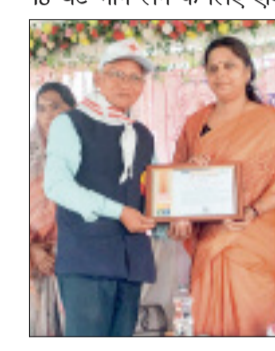
बुक ऑफ रिकॉर्ड्स (एबीएस) अचीवर सर्टिफिकेशन, 24 घंटे भाग लेने के लिए वर्ल्ड रिकॉर्ड

किए। पाणिग्राही को अलग-अलग कटेगरी में वर्ल्ड रिकॉर्ड सर्टिफिकेशन प्राप्त हुए। मैराथन में 18 घंटे भाग लेने के लिए एशिया